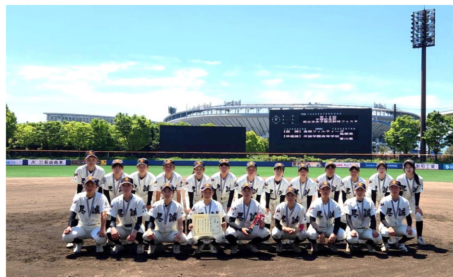
準優勝：尽誠学園高校