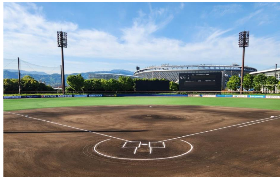
マドンナスタジアム (愛媛県松山市)