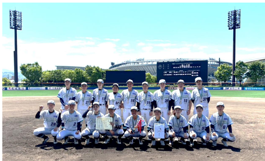
優勝：島根フィルティーズ